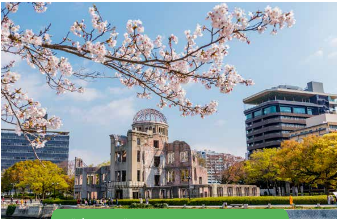
בירושימה שומרו רק בניינים ספורים – ביניהם "אנדרטת השלום" – כתזכורת לאסון