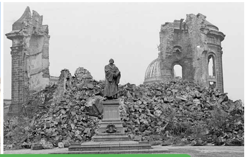
יופיה של הפנינה האדריכלית הזו, שהתאדרה בבניינים בסגנון הבארוק, נמחק בהפצצות שגבו את חייהם של 25 אלף בני אדם.