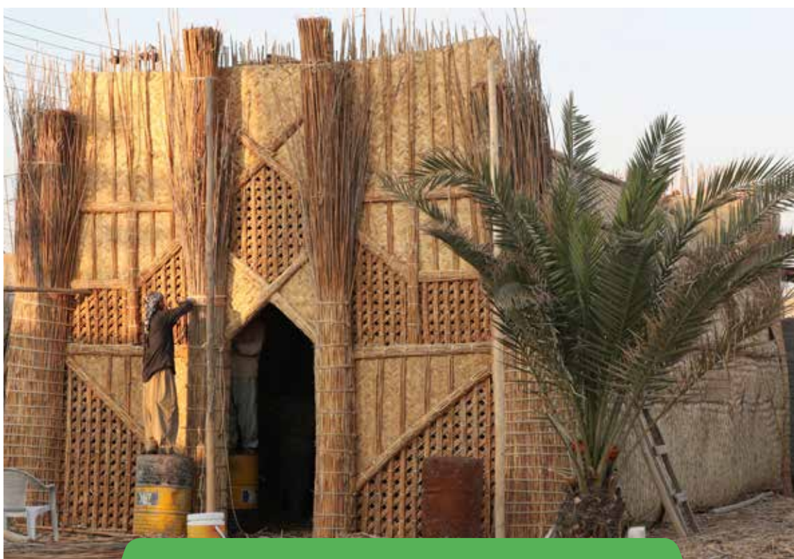
שחקנים בינלאומיים צריכים לאמץ גישה גמישה להתמודדות עם האופי הנזיל והמורכב של שיקום