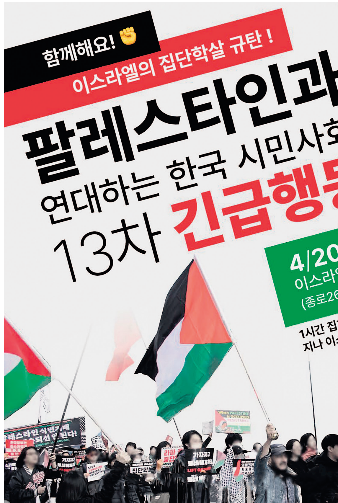
קריאה להפגנה פרו-פלסטינית בדרום-קוריאה. אנטישמיות במדינות בהן כמעט אין מגע עם יהודים