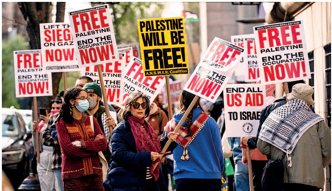
מחאה אנטי-ישראלית ביפן. רוצים להיות חלק מהטרנד המערבי

יורי גנקין: "בסין צריך להראות לקהלי היעד את המכנה המשותף בין המדינות. ביפן ובקוריאה - תכנים על היהדות לעולם"